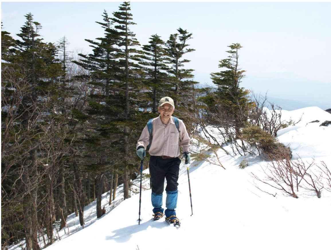
八ヶ岳 前三つ頭 2008/04/09