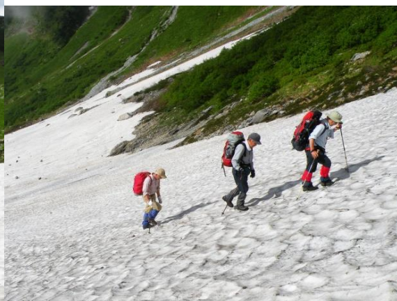
天狗のコルへ向けて 2009/07/30