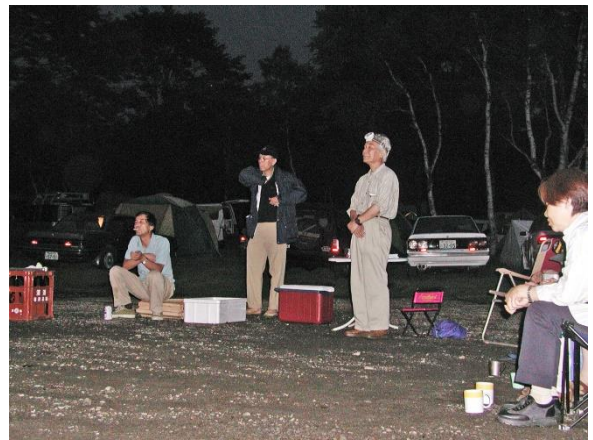
戸隠 紅茶会 2001/08/04