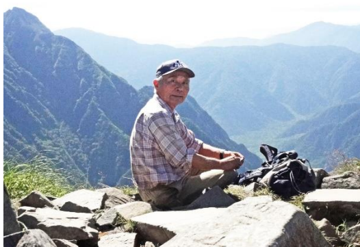
梓川を見ながら小休止 2012/08/03

「穂高 2012」合宿の山行として右俣へ行った4人で西穂高へ登った。右俣の時とは違って変わって雲一つ無い快晴。