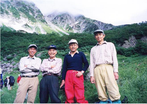
60年記念山行 右俣 1999/08/06