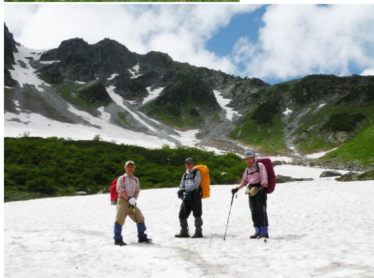
テント場上部の雪渓にて 2009/07/30