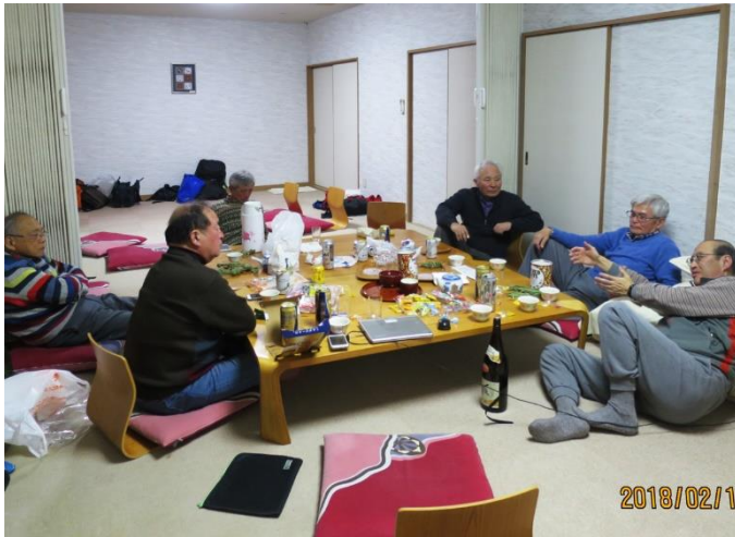
after ski 2018/02.10