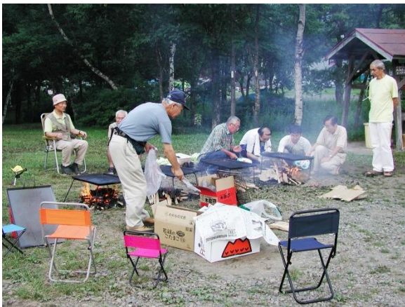
夕食の準備 戸隠 2003/08/01