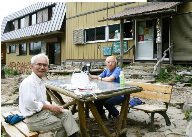
オーレン小屋にて 2006/07/31