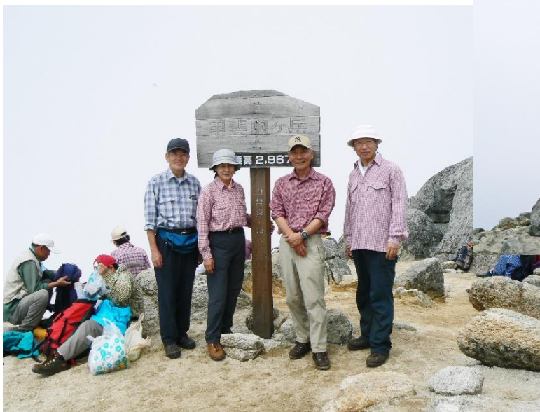
甲斐駒 頂上にて 2007/07/26

この夏も「KSTAC 廻り目平 2007」の前山行として、千丈・甲斐駒の縦走に行った。