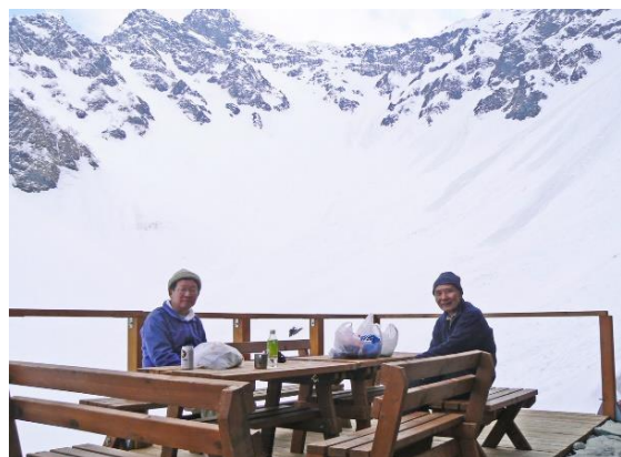
湊沢小屋のテラスにて 2008/05/17