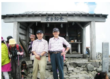
頂上 社の前で 2014/0801