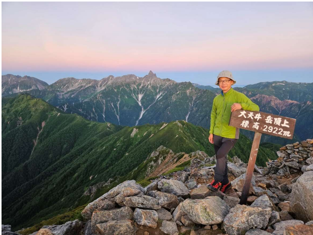
大天井岳頂上にて