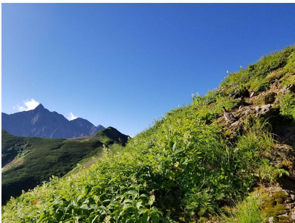
西鎌尾根にて、槍と雷鳥